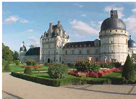
Château de Valençay